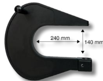
SP735234 Brazo en C 240 mm