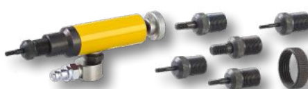
SP735289 Accesorios tuercas remachables