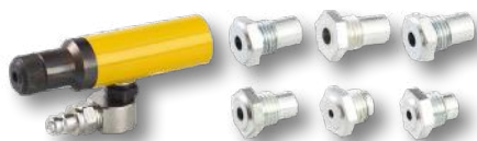
SP735288 Accesorios remaches macizos