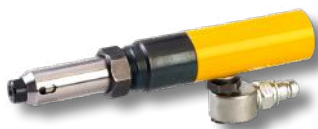
SP735311 Accesorio Pin extractor M5